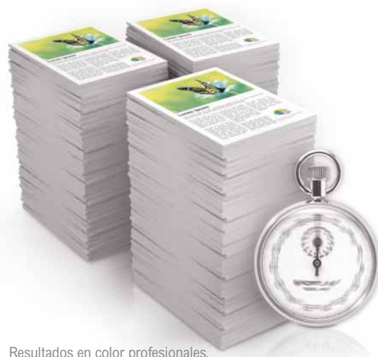
Resultados en color profesionales.

Simple, rápido y exacto; éstas son las nuevas palabras claves de la programación de trabajos. Con la C900 no es necesario ser un usuario experimentado para realizar trabajos de impresión complejos. Gracias a la interfaz compacta con pestañas del controlador EFI, cualquiera puede confeccionar folletos profesionales con unos cuantos clics. La gestión avanzada de documentos y sus funciones de imposición completan este escenario de facilidad de uso.