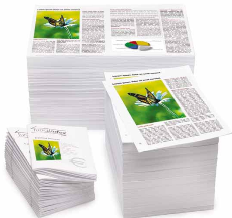
Un amplio abanico de acabados para documentos en color de gran valor.

Para poner la guinda de la perfección a documentos de alto valor, inserte portadas en color o preimpresas utilizando el intercalador de portadas doble. Es la opción idónea para confeccionar catálogos de productos, manuales de usuario y folletos con un aspecto duradero.